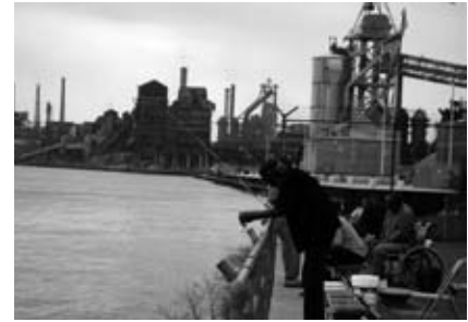
Risque, pollution et droit à la ville et source

L'approche n'est pas la même dans les territoires nord-américains caractérisés par une gestion de type Bottom-up (de bas vers le haut). Cette gestion se manifeste par un Etat plus discret, et une maîtrise de l'urbanisation autour des sites à risque, quasi-inexistante. Des dispositifs de prévention viennent compenser ce manque. C'est le cas des très nombreuses mesures de réduction des sources de dangers, dites « mesures de mitigation » et des actions de concertation existantes autour de cette question. Il existe par conséquent des structures originales qui réunissent tous