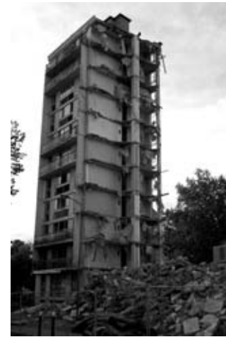
Démolition d'une tour aux Aviateurs (Orly), octobre 2010

La première partie propose une analyse historique et critique des catégories de l'action (quartiers, exclusion, mixité...). Elle montre d'une part comment cette action repose sur le postulat de l'immobilité des populations alors que la mobilité n'a jamais cessé et d'autre part comment le programme de rénovation urbaine de 2003 vient changer le statut de la mobilité. La seconde partie s'appuie sur un ensemble de travaux empiriques. Elle montre comment les opérations de rénovation conduisent à des formes de re-concentration plus que de dispersion, à l'inverse des effets attendus. L'analyse des interactions entre « relogeurs et relogés » apporte un autre éclairage à cet apparent paradoxe, mettant en exergue des effets d'agrégation (Boudon, 1989). La construction de trois grands types de trajectoires résidentielles, à partir de cent vingt entretiens auprès de ménages, permet de mettre en évidence des rapports différenciés au quartier et à la mobilité. Mais elle fait surtout de la trajectoire un instrument d'analyse des effets sociaux et du sens de l'action territorialisée, conduisant à un « autre regard ».