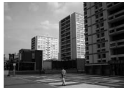
Dalle du Val d'Argent Nord (Argenteuil) Avril 2009

Aujourd'hui, le droit au retour, les priorités données au relogement sur site, les chartes de relogement participent de l'émergence d'un droit des habitants vis-à-vis de leur