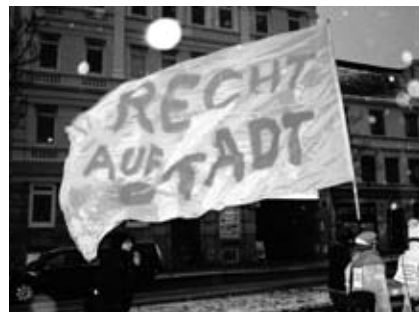
Manifestation de "Recht auf Stadt" sous la neige à Hamburg, novembre 2010

l'idée de « participation des habitants à la vie urbaine ». Il en est de même en France de l'AITEC 3 , pour qui le « droit à la ville » constituerait pour le citoyen le pouvoir de s'engager comme utilisateur de la ville et de critiquer les décisions publiques dans les projets urbains, jusqu'au niveau juridique. Enfin, le « droit à la ville » se rapproche aujourd'hui aussi du « droit au logement », alors que cette notion n'est pas spécifiquement lefebvrienne ; notamment aux Etats-Unis, le « droit à la ville » participe à la défense du logement social et accessible, le public housing. La privatisation du logement social en Allemagne, due à la vente des contingents communaux pour combler des dettes publiques, est également objet de contestation. De même, Habitat International Coalition (HIC) prépare une charte mondiale du droit à la ville, à destination de ses ONG membres qui se réunissent dans les forums sociaux, alors que ce réseau s'est construit historiquement pour le droit à l'habitat et à la justice sociale.